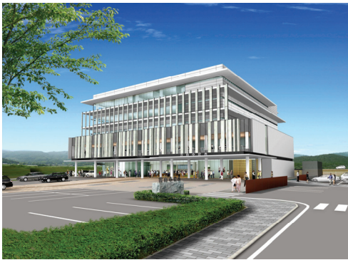
< 外観 >