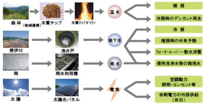
< 再生可能エネルギー利用の概要 >