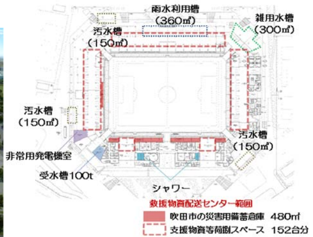
<非常時の防災拠点としての主な取り組み>