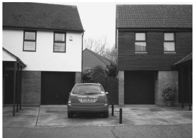
写真3 骨格道路沿いの住宅の前面に設けられた駐車スペース。2戸の駐車スペースが隣接する。（ブレントウッド・プレイス）