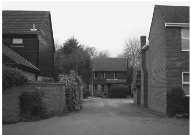
写真2 クルドサックの入口から領域性の高い中庭部分をのぞむ。（ブレントウッド・プレイス）