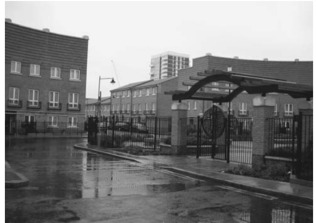
写真4 セントラル・サーカスはコミュニティの中心であり、イベント等にも供される。(ライムハウス地区、ロンドン)

図1に示すとおり、この再開発により犯罪数は大きく減少した。とりわけ侵入盗は、2002年度の数字が1996年度の26%に減少している。ただし、貧困世帯が居住する過密住宅の廃止