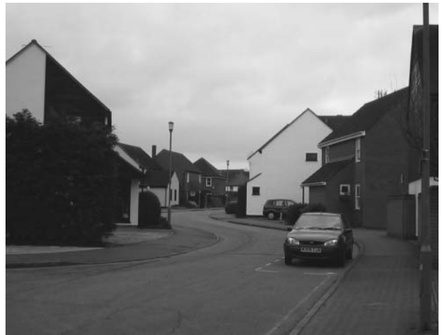
写真1 曲線的な骨格道路は交通静穏化の一手法である。所々に駐車スペースが設けられている。（ブレントウッド・プレイス）

ライムハウス地区はドックランド軽軌道鉄道（DLR）のライムハウス駅から歩いてすぐにある、再開発によって形成された社会住宅 23) 地区である。同地区は、2003年のセキュアー