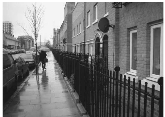
写真5、6 歩道と建物の間には見通しのよい柵が設置され、公私の空間区別を行っている。(ライムハウス地区、ロンドン)