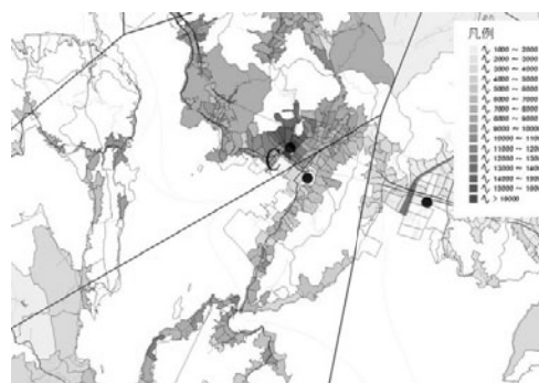
図3 首都圏半島部に位置する病院の受療率

半島に位置し複数の島々をもつ地方都市に位置するC病院の外来患者受療率を示したのが図3である。内陸部や島嶼部からも多数の患者が受診している。競合病院が少ないことに加え、通院距離が遠距離になるほど近接する競合病院との相対的な距離の差が縮まるために多くの患者を獲得していると思われる。