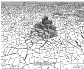
図1 首都圏中心部に位置する病院の受療率

首都圏中心部、首都圏郊外、地方都市と立地状況が異なり、規模や診療機能も異なる病院を対象としたが、結果として外来患者は時間距離に大きく影響を受けることが確認された。図1は首都圏中心部に位置する病院の外来患者数が町丁目の人口に占める割合（受療率）を3次元で示した図であるが、病院の所在地を頂点にして病院までの距離が増加すると受療率が減衰していく様子が分かる。