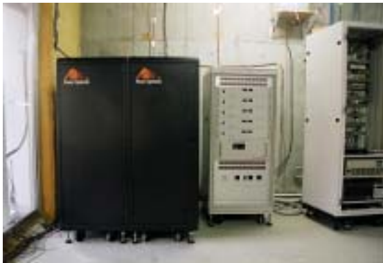
写真 プロトタイプ概観（黒箱がキャパシタバンク）