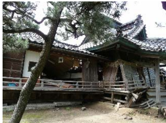
写真 5.34 写真 5.33 の側面