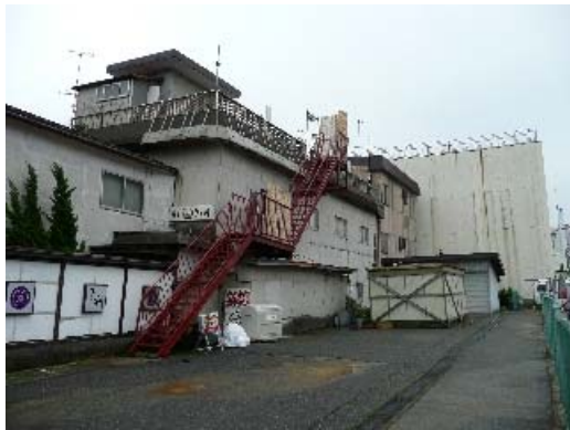
写真 8.21 建物外観