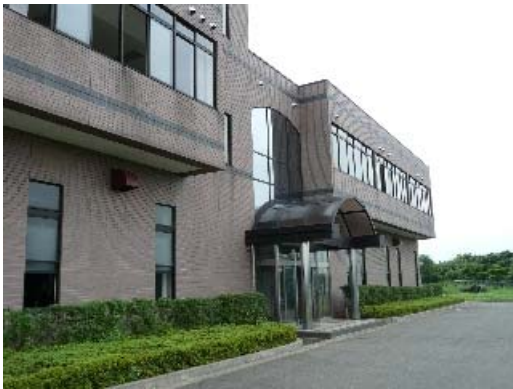
写真 6.11 煙突脇の建物