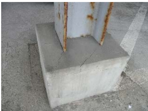
写真 5.40 柱脚コンクリートのひび割れ