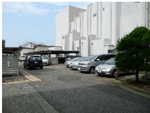
写真 8.30 K-net 柏崎と震度計の位置関係