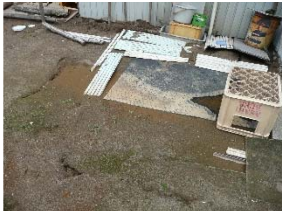
写真 5.27 写真 5.23 の敷地の噴砂痕