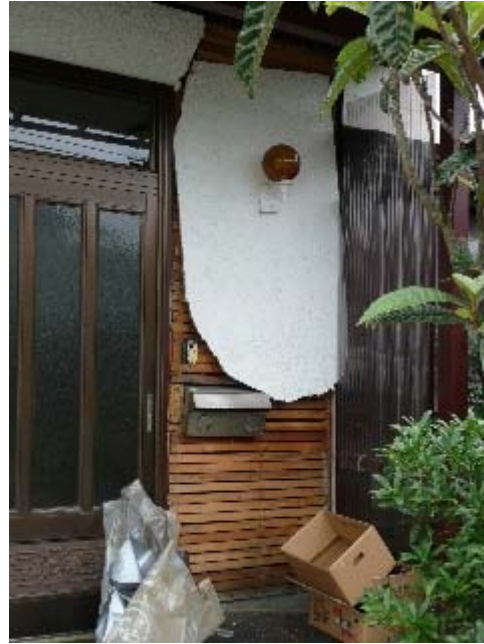
写真 5.22 写真 5.21 の住宅の玄関部分