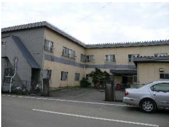
写真 5.55 一部損壊（裏手部分）した軽量鉄骨造