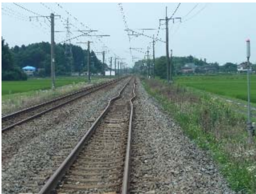
写真 8.36 線路の歪み