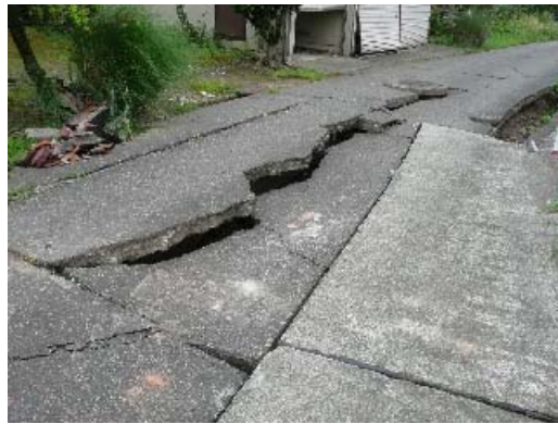
写真 8.33 地盤の被害状況