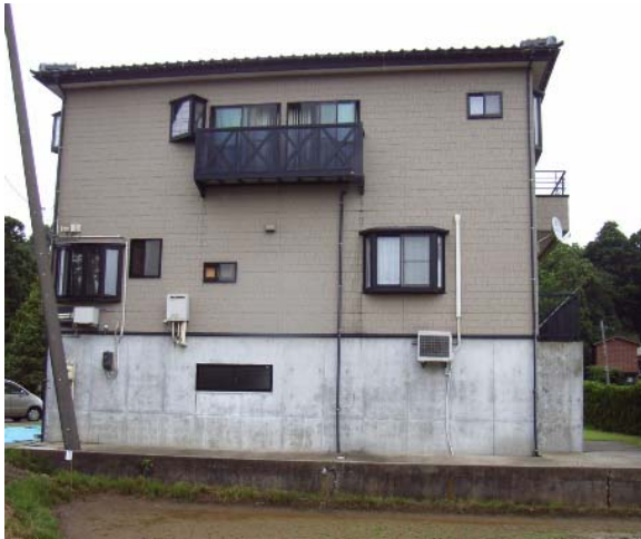
写真 5.5 ほぼ無被害の高床式住宅