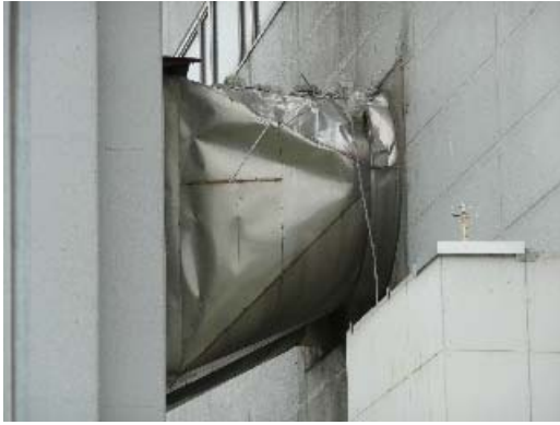
写真 6.9 煙突と建屋間の配管の損傷