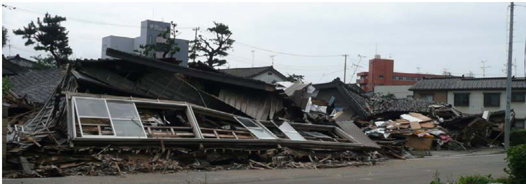
写真 5.28 倒壊家屋が連続する新花町