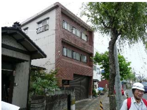
写真 7.9 建物外観