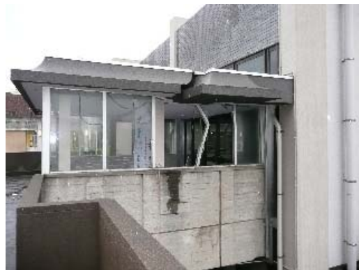
写真 8.24 渡り廊下の損傷