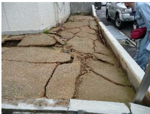
写真 8.7 建物周囲の地盤の被害