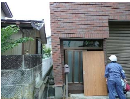
写真 7.10 ねじりの残留変形