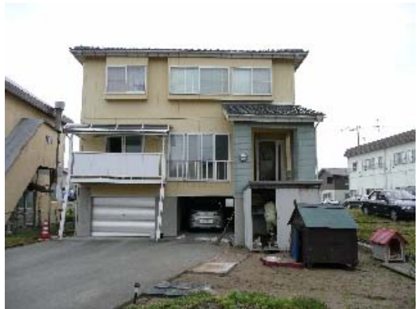
写真 5.54 地盤変状により大きな被害を受けた 高床式木造（1階部分 RC 造）