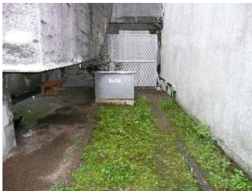
写真 8.29 震度計