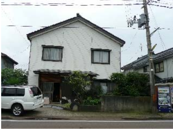
写真 5.21 多少の残留変形が残る住宅