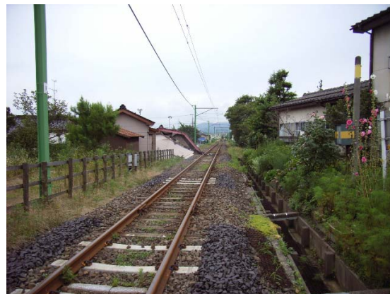
写真 5.10 線路に向かって倒壊した家屋