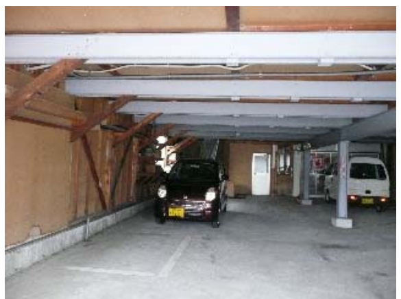
写真 5.39 写真 5.35 の1階部分の大空間