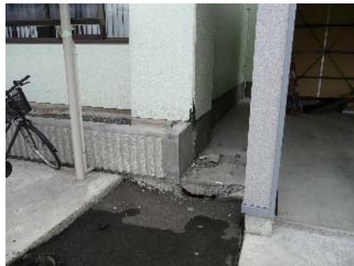
写真 6.4 かぶりコンクリートの剥離