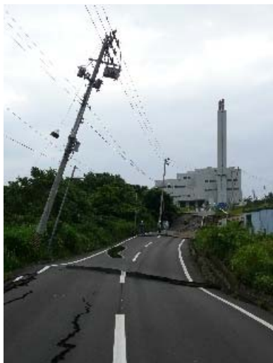
写真 8.41 地盤の被害状況