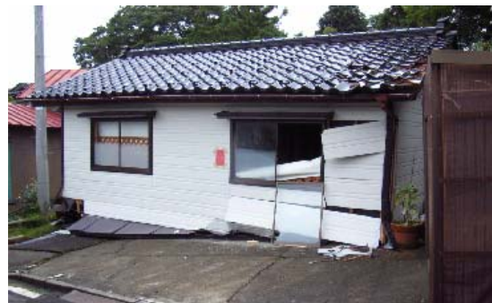
写真 5.2 新しい構工法でも倒壊した 1階を車庫等にした家屋