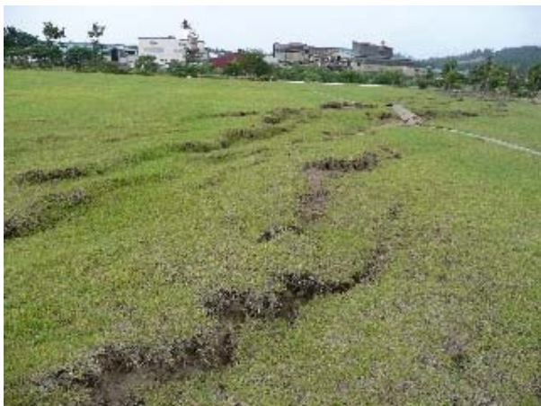
写真 5.49 鯖石川記念公園中央を貫くひび割れ