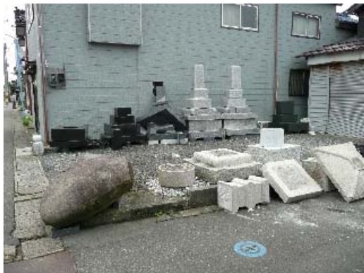
写真 8.15 墓石、灯籠の転倒