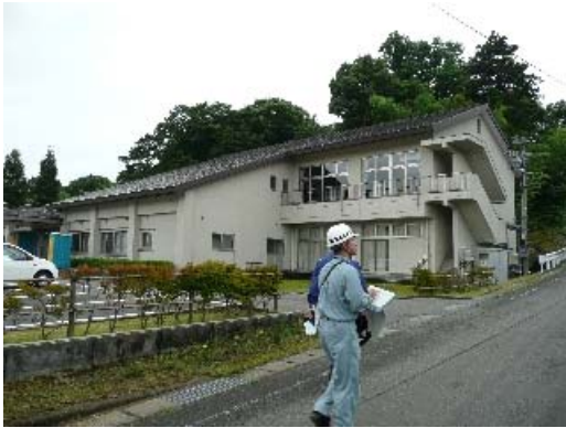
写真 6.1 建物外観