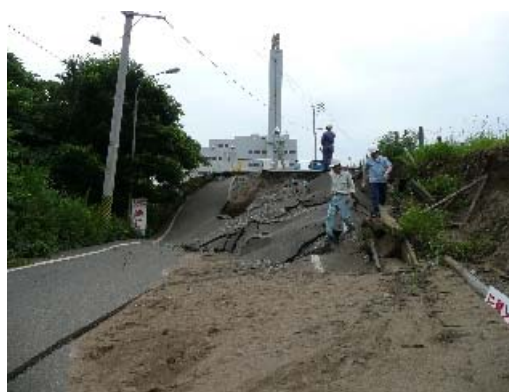
写真 6.6 煙突遠景と近辺地盤の被害