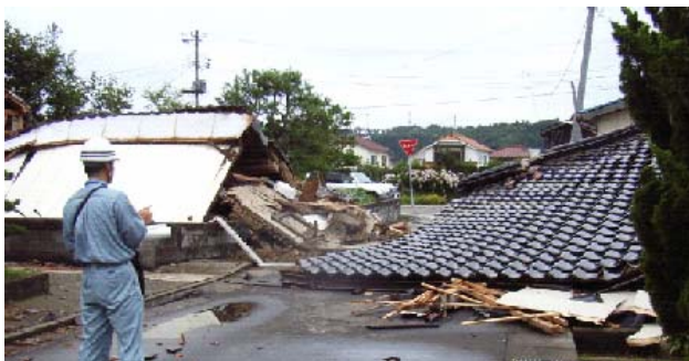
写真 5.1 倒壊して道路を塞いだ木造家屋