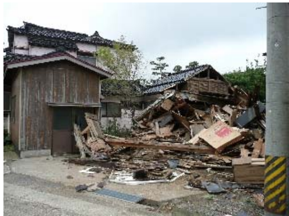
写真 5.37 車庫又は倉庫と推測される倒壊家屋