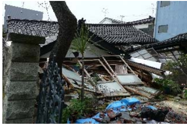
写真 5.32 写真 5.31 近景（土塗り壁の残骸が確認された）