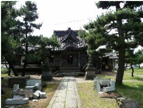
写真 5.33 壊滅的な被害を受けた新花町の金比羅宮