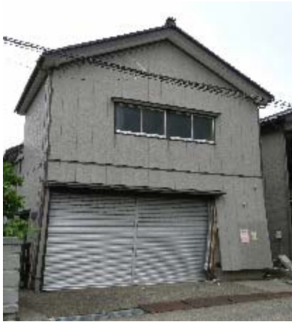
写真 5.41 1階が大きく傾いた車庫