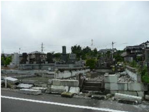
写真 8.14 墓石の状況