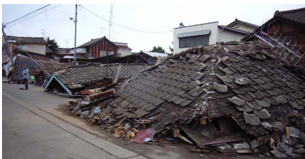
写真 5.11 軒並み倒壊した古い構法による家屋