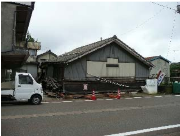
写真 5.36 倒壊した店舗併用住宅