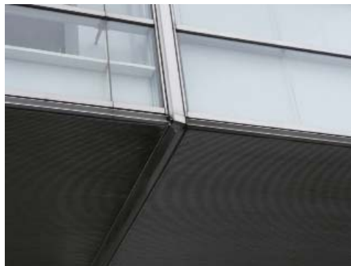
写真 8.17 Exp.J.のずれ