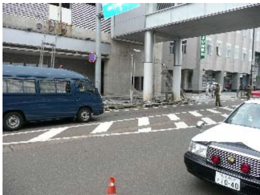
写真 8.16 渡り廊下下部の地盤被害