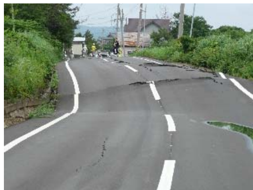
写真 8.42 地盤の被害状況