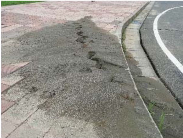
写真 5.47 鯖石川記念公園駐車場の噴砂痕