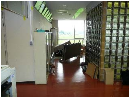
写真 8.13 家具等の散乱