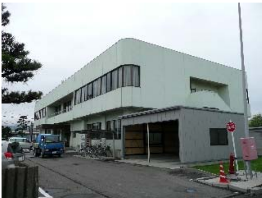
写真 6.3 建物外観