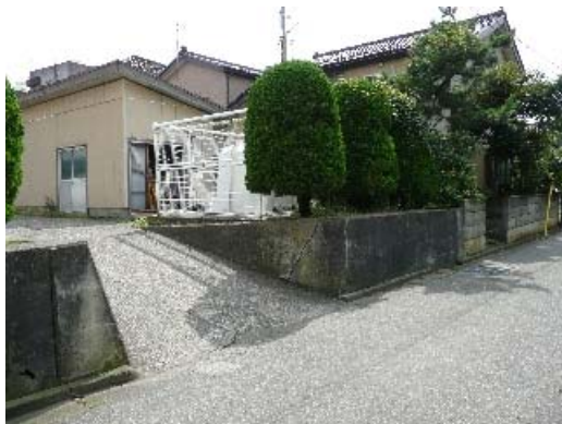
写真 8.27 K-net 柏崎