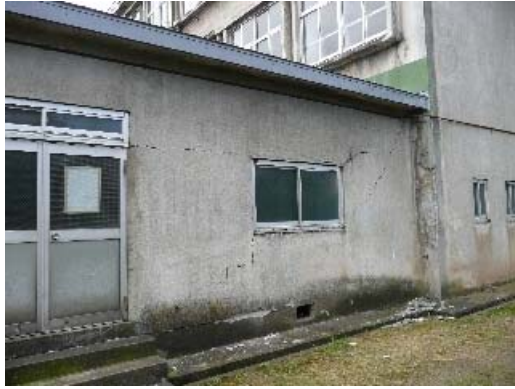
写真 6.19 渡り廊下の壁，接合部分の損傷