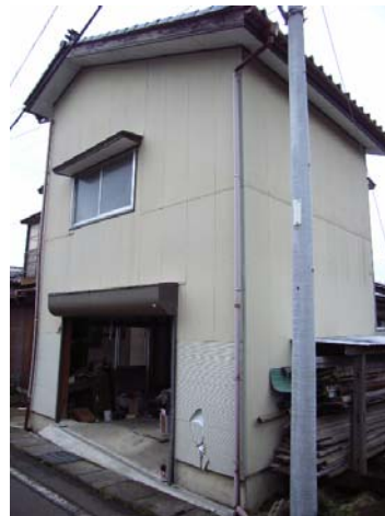
写真 5.6 外観上無被害の車庫