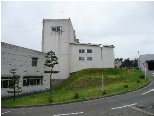
写真 7.5 建物外観