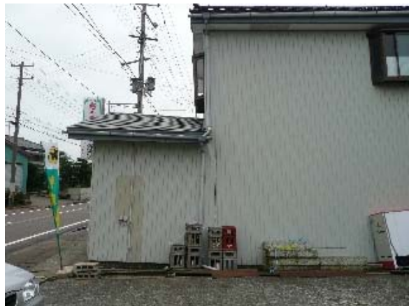
写真 5.24 写真 5.23 の側面（平屋と2階建て部分の境界付近が不同沈下）