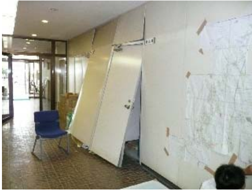
写真 8.11 間仕切壁の損傷