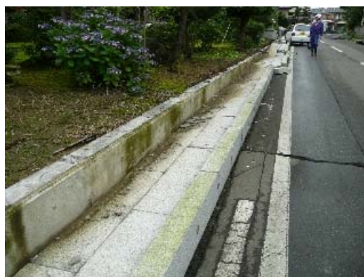
写真 8.2 倒壊したへい