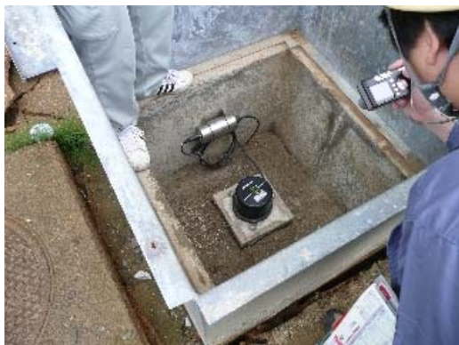
写真 8.9 震度計