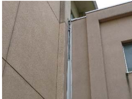
写真 6.22 Exp.J.の損傷