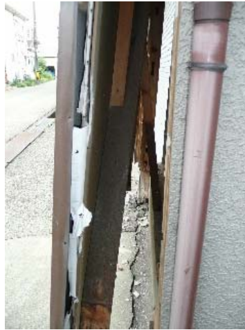
写真 5.42 写真 5.41 の前面開口脇の 無開口壁に入る正角筋かい