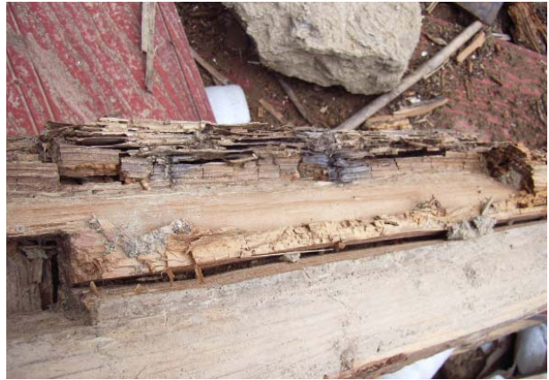
写真 5.15 土壁を有する古い構法の倒壊家屋 写真 5.16 写真 5.15 の建物の部材の腐朽・蟻害