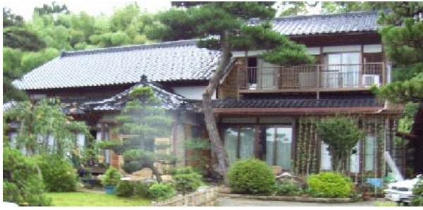
写真 5.3 比較的築年数が浅いように見受けられるにもかかわらず、残留変形が大きい木造家屋