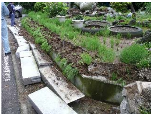
写真 8.3 倒壊したへい