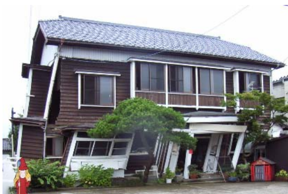
写真 5.13 残留変形が大きい総2階の木造