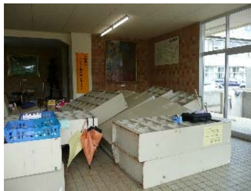
写真 6.18 靴箱の転倒