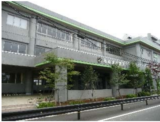
写真 6.14 建物外観