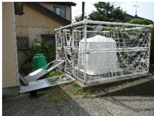
写真 8.28 K-net 柏崎