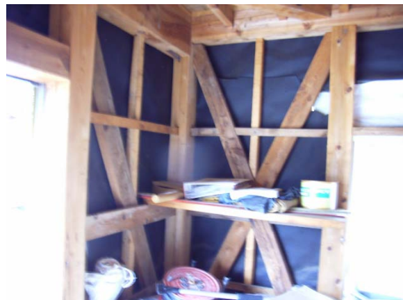
写真 5.8 写真 5.6 の筋かい