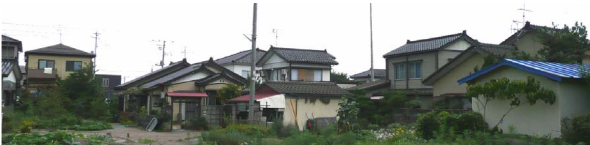
写真 5.35 比較的新しい住宅が立ち並ぶ春日地区