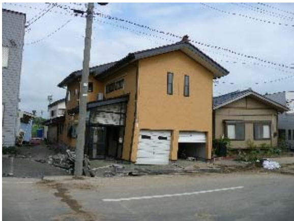
写真 5.53 地盤変状により大きな被害を受けた 木造住宅