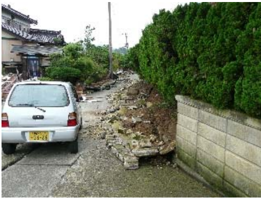
写真 8.32 塀の被害状況