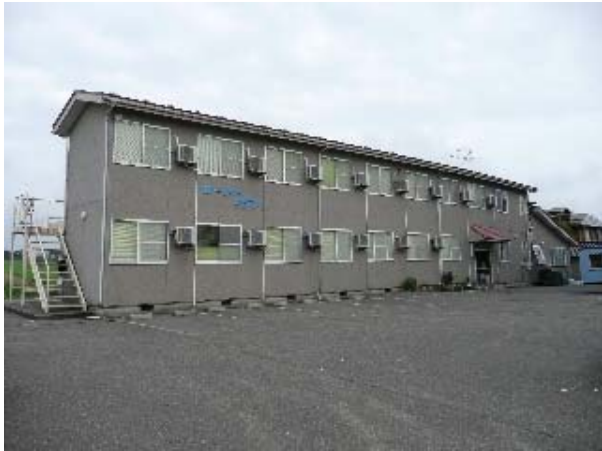
写真 5.57 一部損壊（裏手部分）した木造共同住宅