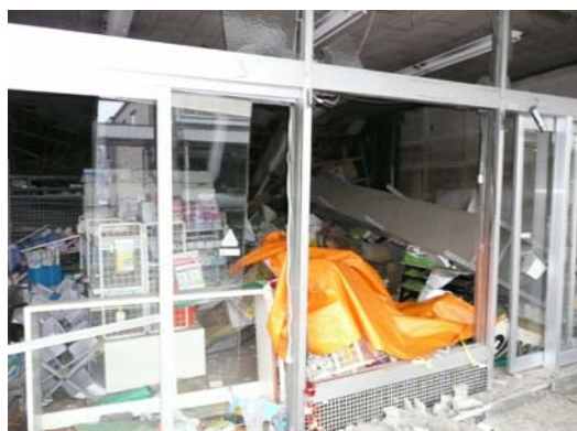
写真 8.18 商店内部の状況