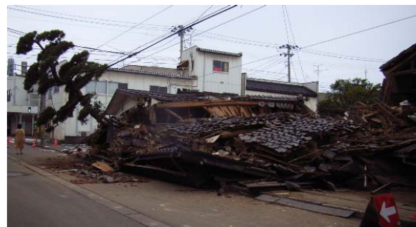
写真 5.14 樹木を倒して倒壊