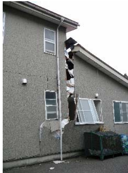
写真 5.58 写真 5.57 の下屋部分の継ぎ目部の破壊