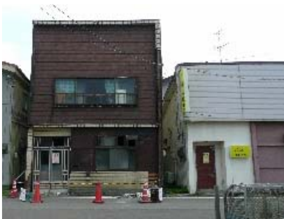
写真 5.29 新花町の店舗