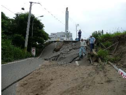
写真 8.39 地盤のずれ

・地盤の被害が特に激しく、地割れが平成橋の南西から鯖石川改修記念公園にかけて見られる（第5章参照）。また、この地割れは煙突に損傷が見られたごみ処理場の方向に向けて延びており、ごみ処理場脇では、高さ方向に3m程度の大きな地盤のずれが見られる。（写真 8.39～8.42）