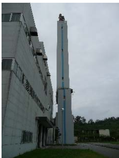
写真 6.5 煙突全景