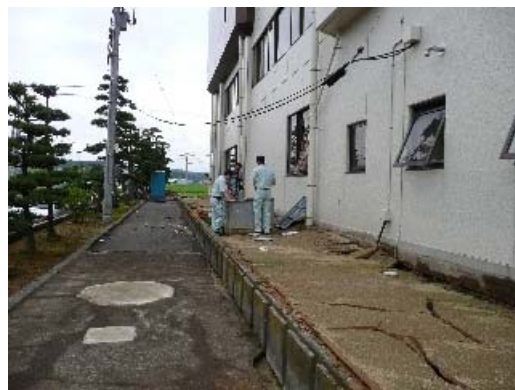
写真 8.8 建物周囲の地盤の被害