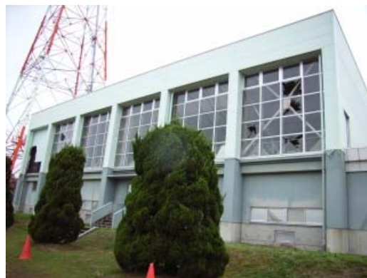
写真 7.3 ガラスの破損