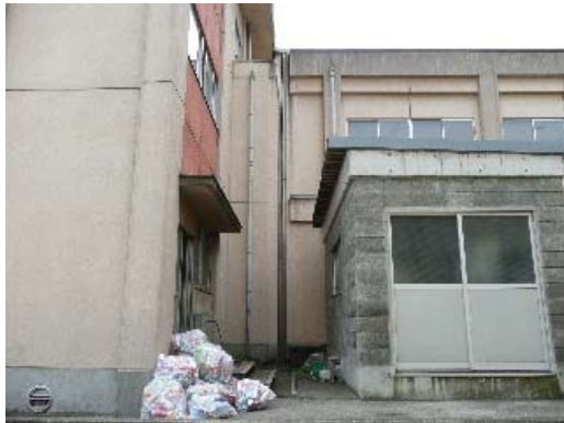
写真 6.21 Exp.J.の損傷