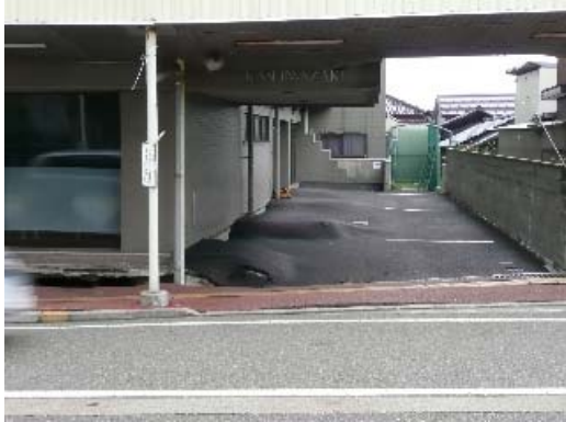
写真 8.19 地盤沈下による建物との間の段差