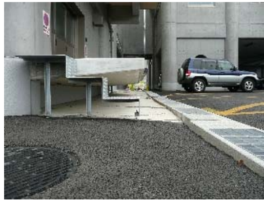
写真 6.15 地盤被害による変位