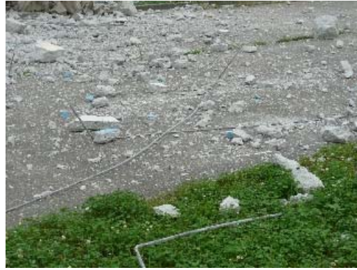
写真 6.10 散乱したコンクリート，鉄筋の破片