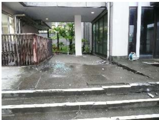
写真 8.23 建物周辺の地盤状況