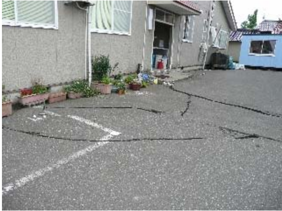
写真 5.45 写真 5.38 の北北東へ続くひび割れ