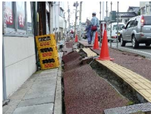
写真 8.20 激しい地盤沈下