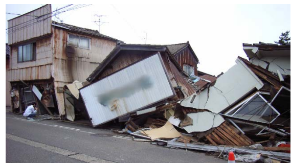
写真 5.12 倒壊した店舗併用住宅