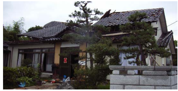
写真 5.4 小屋組の一部が崩壊する希有な被害例