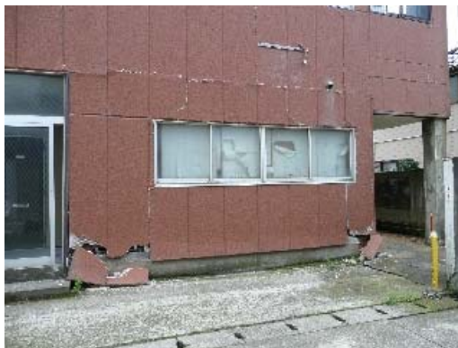
写真 7.12 外壁の損傷