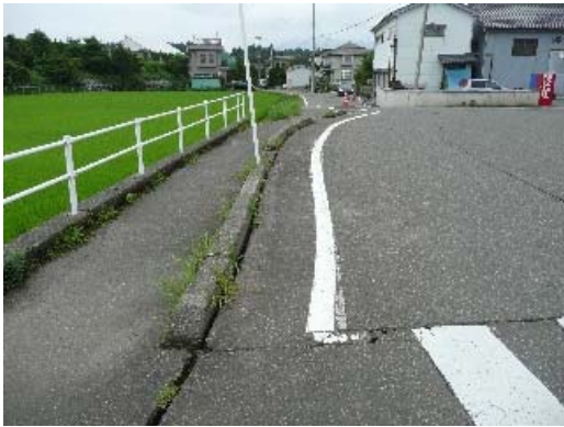
写真 8.31 地盤の被害状況