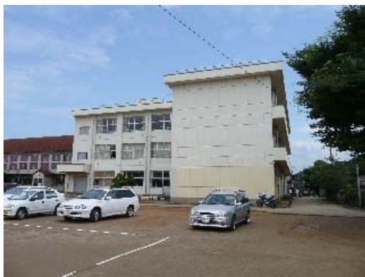
写真 6.17 建物外観