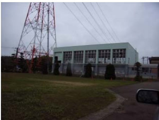
写真 7.2 建物外観