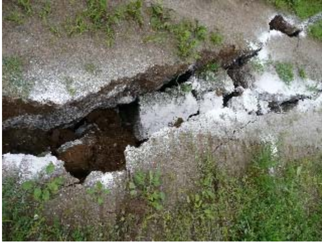
写真 5.51 鯖石川記念公園北側の土手を貫くひび割れ（深さ 1 m 以上）の北端部付近