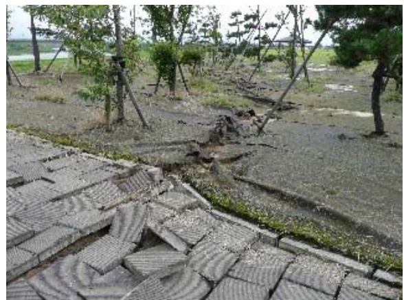
写真 5.50 鯖石川記念公園の北端部付近