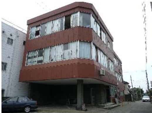
写真 7.11 建物外観