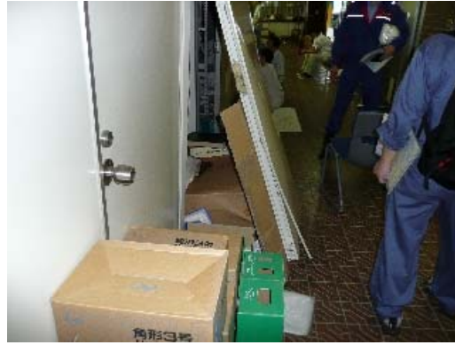
写真 8.12 間仕切壁の損傷