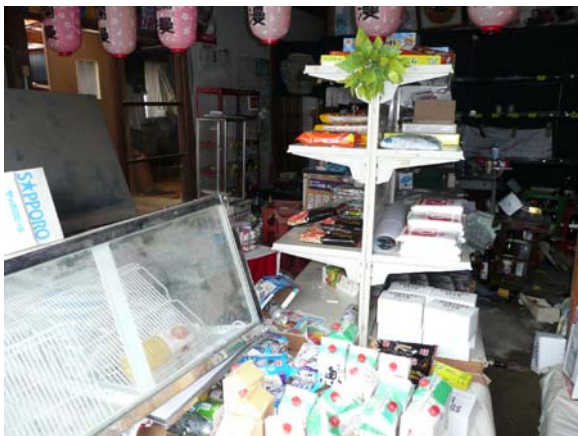
写真 5.25 写真 5.23 の店舗部分で散乱した商品