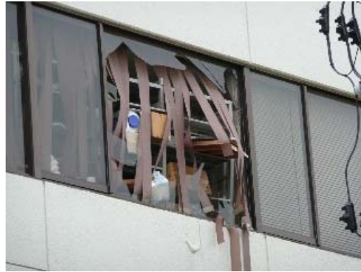
写真 8.6 家具等の衝突によるガラスの破損