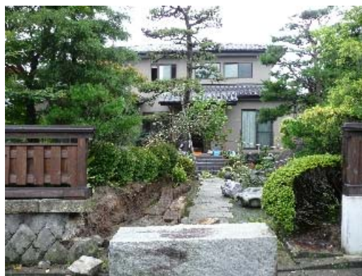
写真 8.4 転倒した石柱