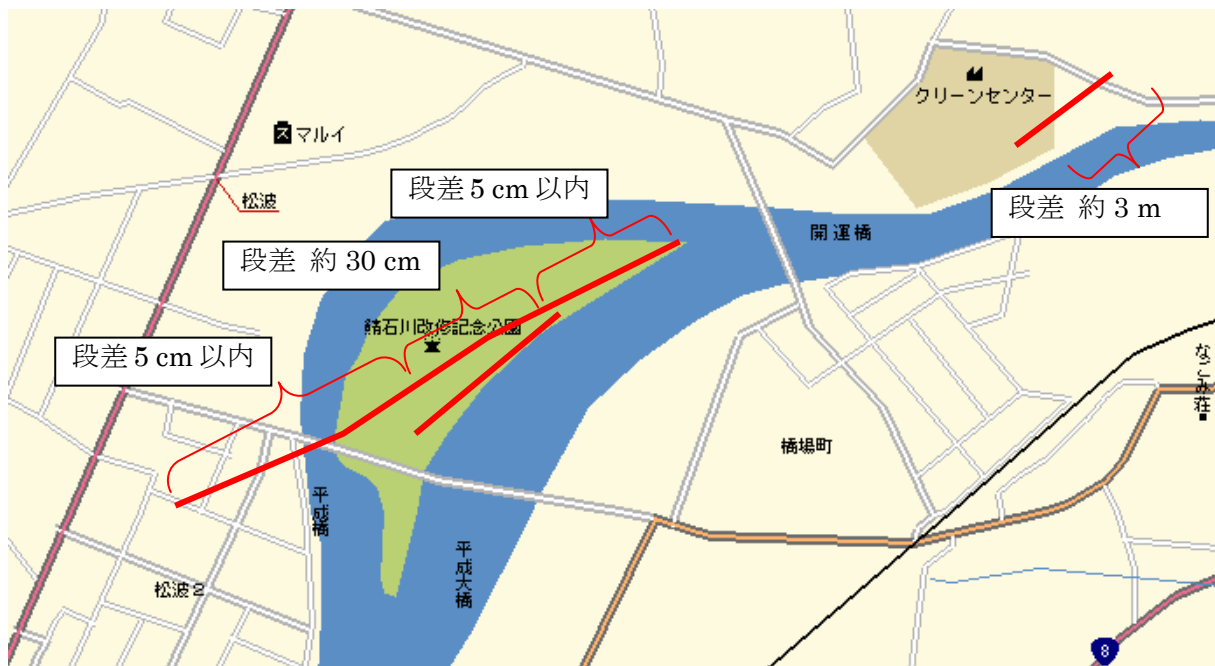
図 5.3 柏崎市松波～橋場町で確認した地割れの位置