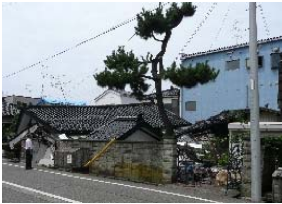
写真 5.31 一見新しい住宅に見える倒壊家屋