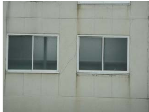
写真 7.6 外壁の損傷