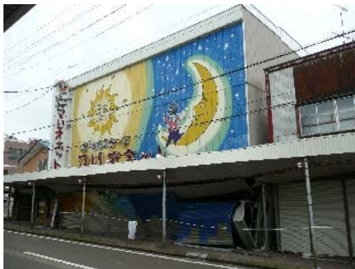
写真 7.7 建物外観