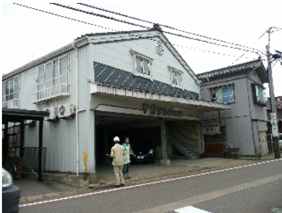
写真 5.38 1階に大きな車庫を取り、鉄骨と木造を併用した例