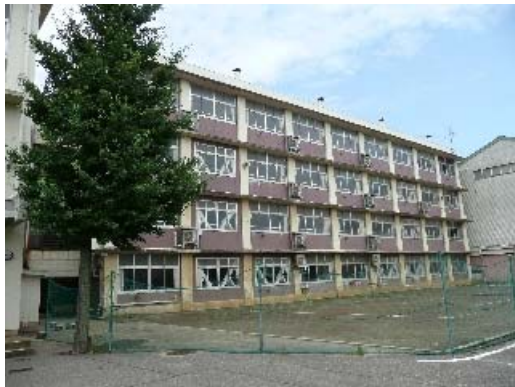
写真 6.20 耐震補強済みの建築物