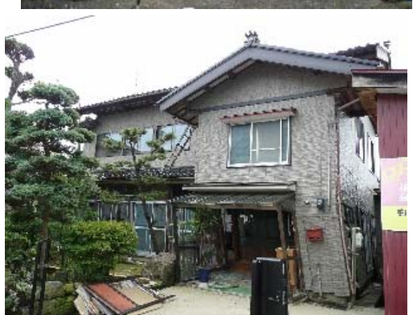
写真 5.20 残留変形が大きい住宅