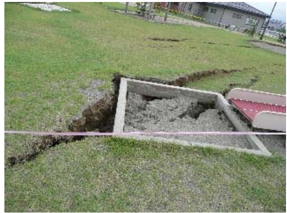
写真 5.48 鯖石川記念公園の遊具施設を貫く地面のひび割れ