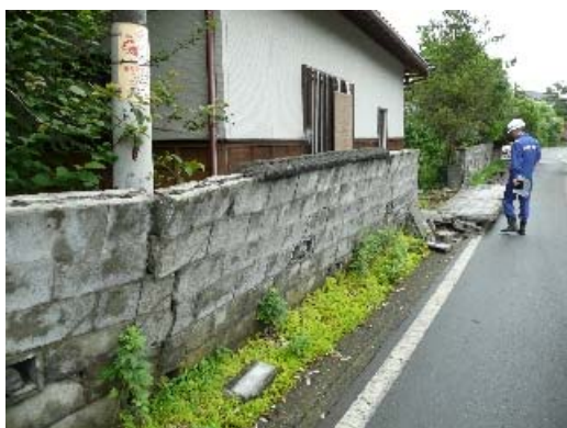
写真 8.1 倒壊を免れたへい