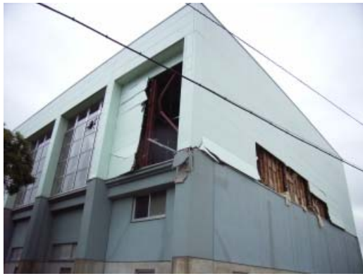
写真 7.4 外壁の剥離