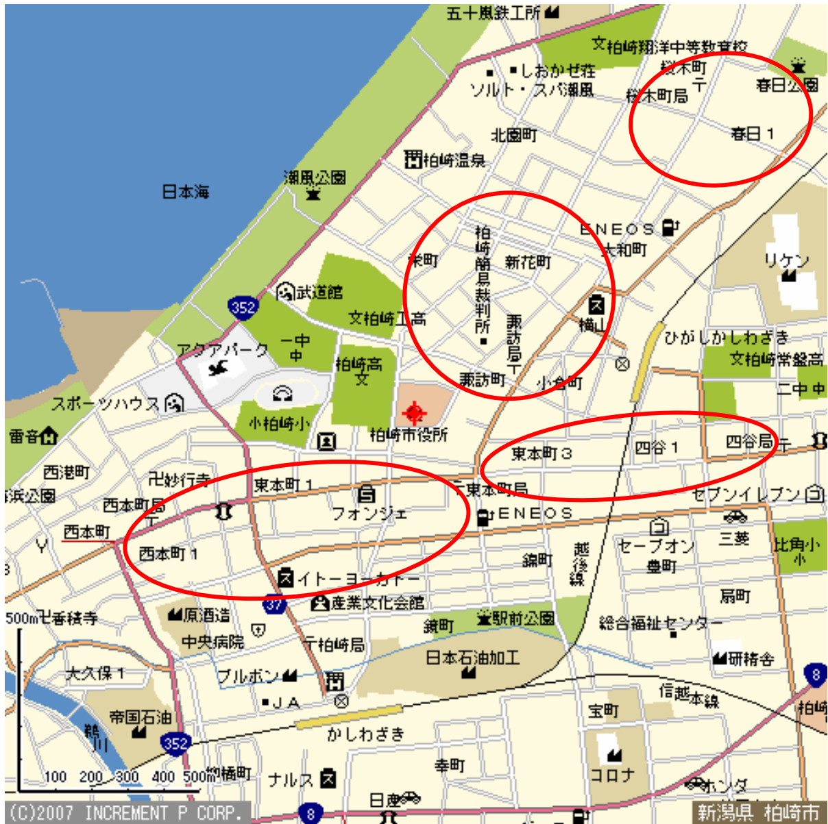
図 5.2 柏崎市役所周辺の調査地 (赤丸の箇所)