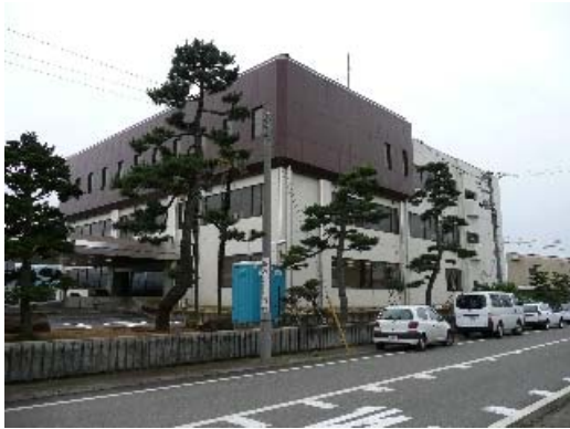
写真 8.5 建物外観