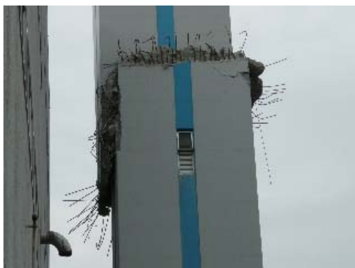
写真 6.7 煙突の損傷部