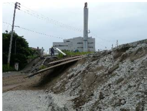
写真 8.40 地盤のずれ