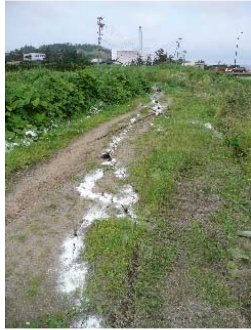
写真 5.52 ひび割れの進む方向にある 損傷したクリーンセンターの煙突