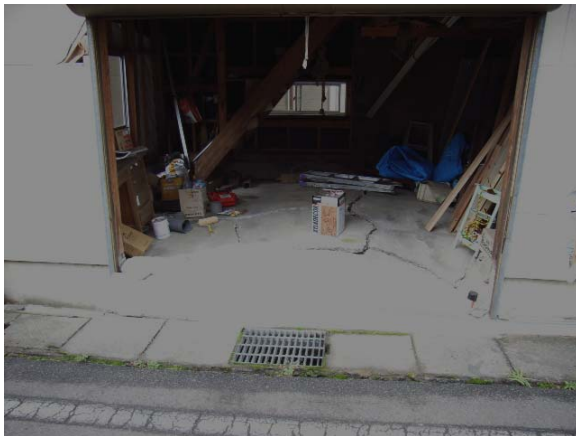
写真 5.7 写真 5.6 の土間コンのひび割れ