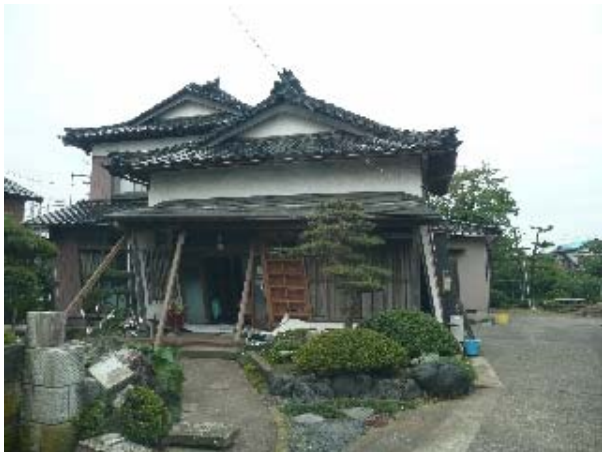
写真 5.19 大破した比較的古い構法による住宅