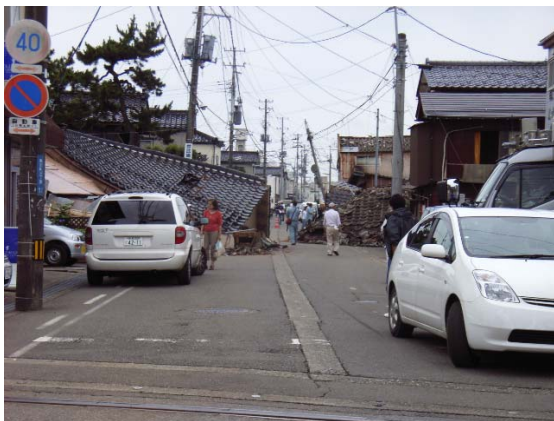
写真 5.9 東本町3丁目の倒壊家屋群