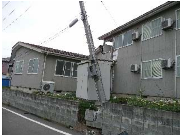
写真 5.60 写真 5.57 の建物の敷地の擁壁の崩壊