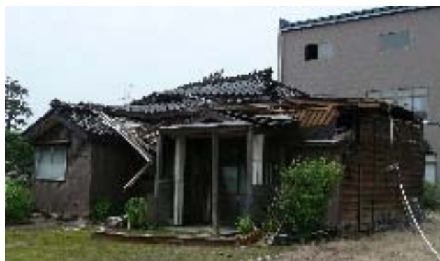
写真 5.30 2階が崩壊した例