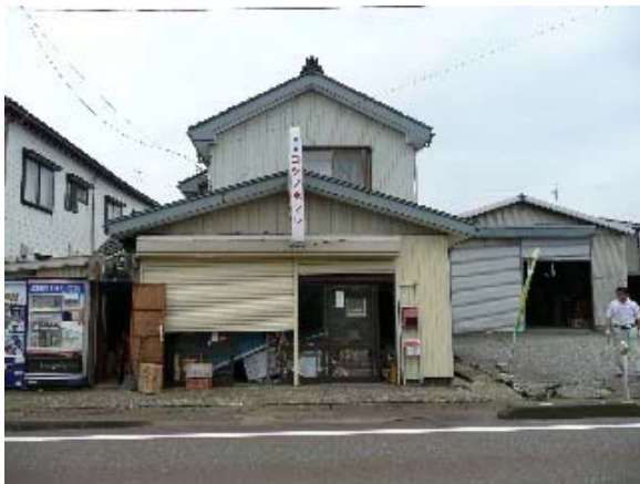
写真 5.23 地盤変状により被害を受けた店舗併用住宅