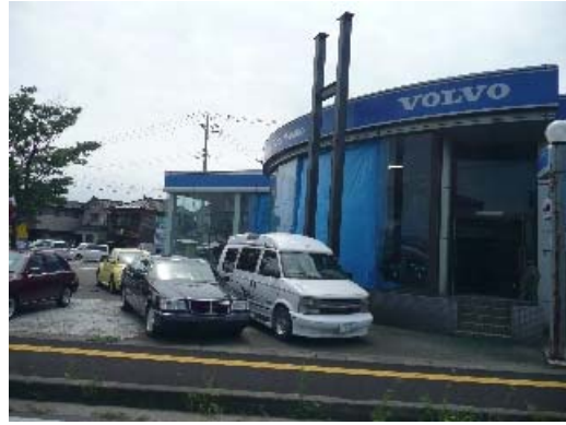
写真 8.37 外階段の外壁タイルのひび割れ 写真 8.38 ショーウィンドウのガラスの破損