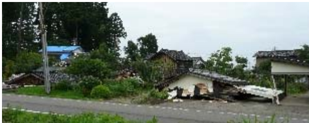
写真 5.17 多くの車庫、倉庫が倒壊

車庫、倉庫、納屋、作業所の類の被害が中心で、その被害は倒壊を含むおおきなもの（写真 5.17）が多かった。比較的新しい車庫、倉庫で倒壊している例（写真 5.18）も確認された。確認した範囲では、倒壊した住宅は極わずかである。大破など住宅の被害は、土塗り壁を揺する比較的古い構法（写真 5.19）によるもので、この地域には少なかった。この地域には比較的新しい住宅（概ね築 30 年以下と推定される）が多く、たまに残留変形が大きな住宅（写真 5.20）がある。また、通りに面した間口に筋かいが確認できない（写真 5.22）住宅に、せん断変形が大きく残った例（写真 5.21）、地盤変状（写真 5.26、噴砂痕有り＝写真 5.27）による被害（写真 5.23、5.24、5.25）などが確認された。