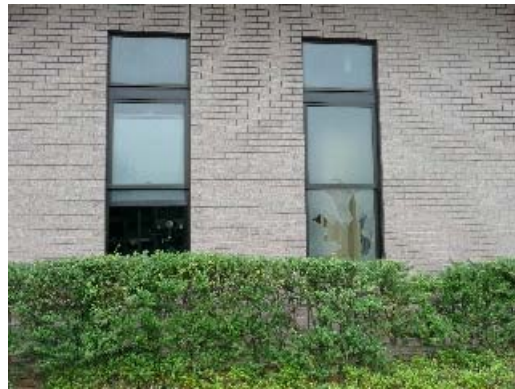
写真 6.12 ガラスの破損