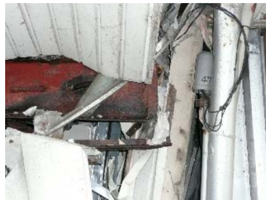
写真 7.8 鉄骨梁の傾斜