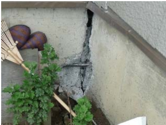
写真 5.59 写真 5.57 の建物の破壊された基礎