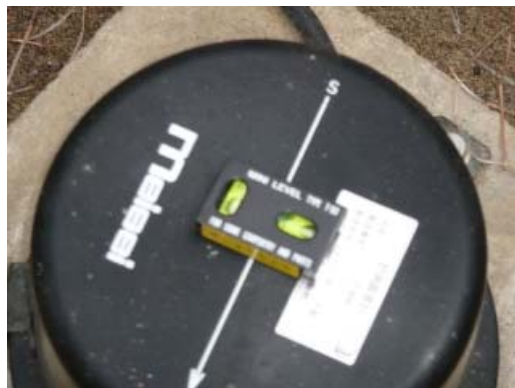
写真 8.10 震度計の水準器