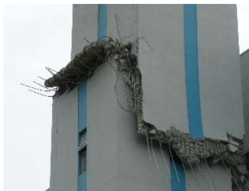
写真 6.8 煙突の損傷部