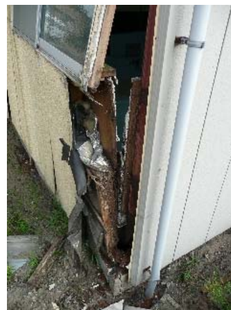
写真 5.56 写真 5.55 の裏側の被害