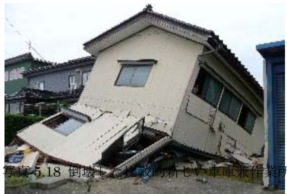
写真 5.18 倒壊した比較的新しい車庫兼作業所