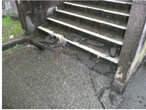
写真 8.26 建物周辺の地盤状況