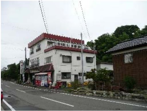
写真 7.1 建物外観