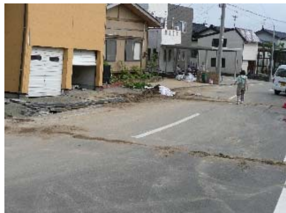
写真 5.44 アスファルトを貫くひび割れ (写真 5.37 の北東方向)