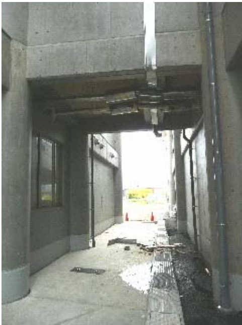
写真 6.16 Exp.J.の損傷