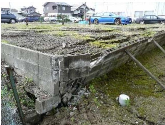
写真 5.43 駐車場地面のひび割れと擁壁の崩壊

柏崎市松波地区は、比較的新しい住宅 (概ね築 15 年以下と推定) が多く、液状化を含む地盤被害が顕著であった。特に平成橋の南西から、鯖石川改修記念公園にかけて大きな地割れ (写真 5.43 ~52) が走り、木造 (写真 5.53)、1 階を RC 造とする高床式の木造 (写真 5.54)、軽量鉄骨造の社員寮 (写真 5.55、5.56)、集合住宅 (写真 5.57) などの建物が被害を受けていた。集合住宅 (写真 5.57) の被害は、下屋部分の継ぎ目が分裂 (写真 5.58) し、鉄筋入りの基礎も破断 (写真 5.59) していた。地割れは建物の下部を通り抜け、反対側の擁壁も破壊 (写真 5.60) していた。建物の地面のひび割れの位置を図 5.3 に示す。この地割れは、クリーンセンターの損傷した煙突の方向へ延び、煙突近辺では約 3 m の高低差の断層 (第 8 章参照、写真 8.37、8.38) を生じていた。