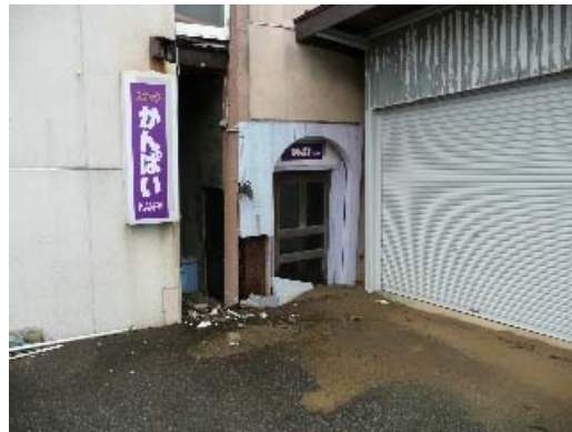
写真 8.22 地盤に沈下による構面の沈み込み