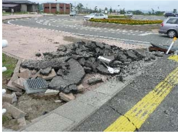
写真 5.46 鯖石川記念公園駐車場へ続く地面のひび割れ