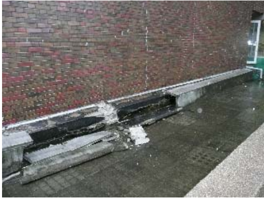
写真 8.25 Exp.J.の被害状況