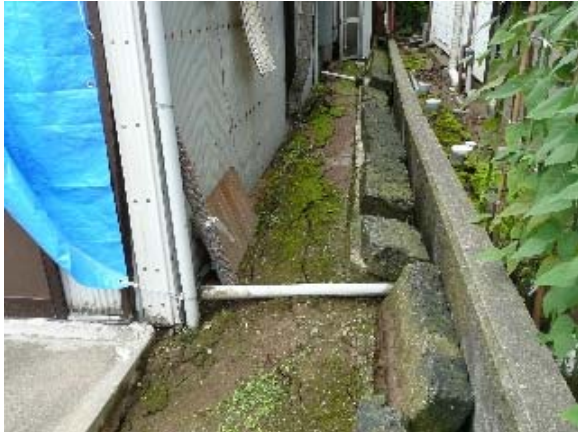
写真 5.26 写真 5.23 の敷地の変状