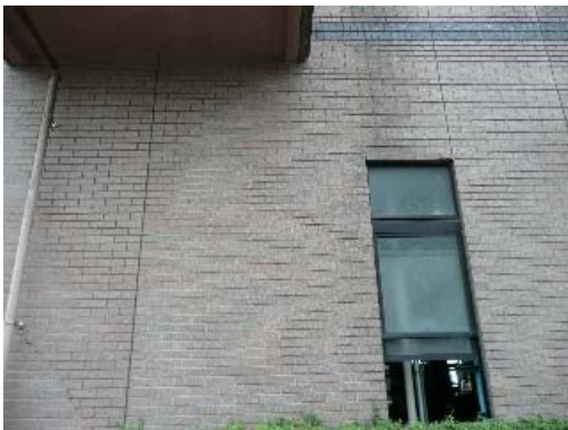
写真 6.13 タイルの斜めひび割れ