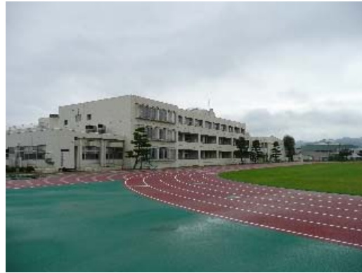
写真 6.2 建物外観